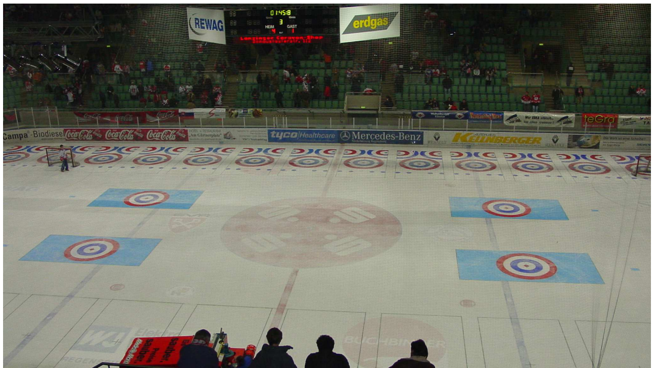
- farbige Zielfelder bei der EM in Regensburg -